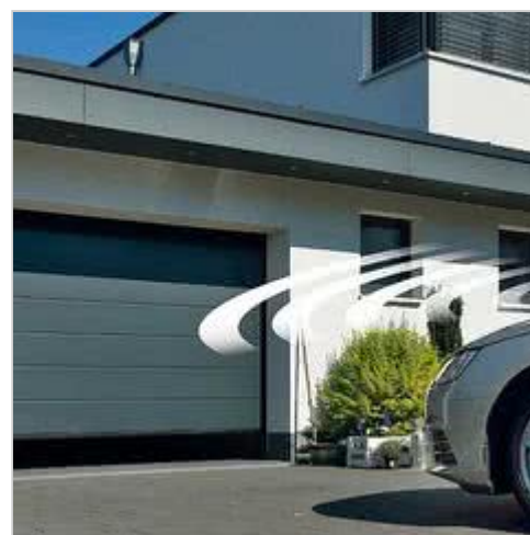
LPU 67 Thermo – energooszczędna brama firmy Hörmann