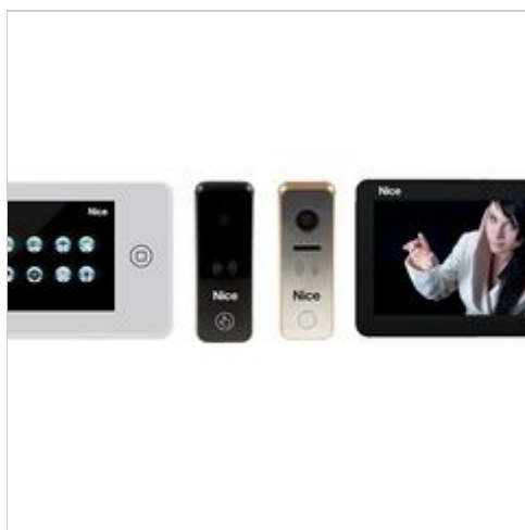
Nice Polska uzupełnia swoją ofertę o wideodomofony