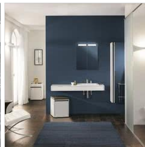
Vivia od Villeroy & Boch – oaza wellness zbudowana na własnych warunkach